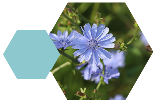
Cichorei Cichorium intybus