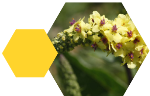
Zwarte toorts Verbascum nigrum