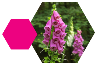
Vingerhoedskruid Digitalis purpurea