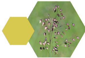
Bevertjesgras Briza media